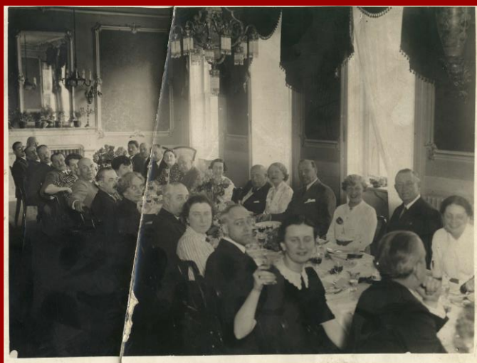
Az egyesület elnöksége 1930 körül a Centrál kávéházban